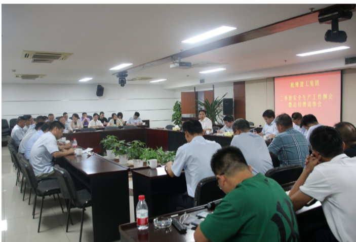
题就推给领导、推给上级,要养成在工作中善于发现问题、分析问题和解决问题,以此来不断提升综合能力素质。

二要坚定提升履职能力和业务水平不松劲 要坚定地提升各级的履职能力和业务水平,把“发现不了问题是失职,解决了问题是尽职”作为工作准则,做到既要善于发现问题,更要能解决问题,不能遇到问题绕道走,放任问题不管,也不能一遇到问