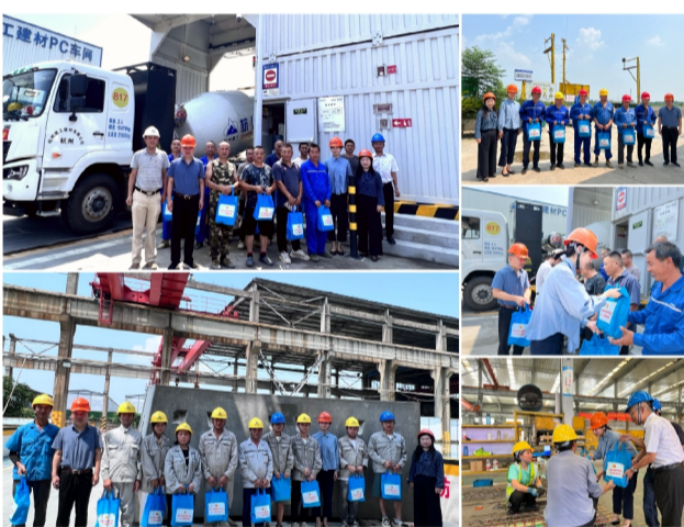
引领职工、服务大局、共促发展的作用。 （杭构集团 朱哲韵）

在听取汇报后，省建设建材工会和市建设工会领导对杭构集团工会工作开展情况表示肯定，并希望杭构集团工会在今后的工作中要借鉴好经验，宣传好做法，取得新突破，探索出更多创新举措，取得新的成绩，发挥好企业工会围绕中心、引