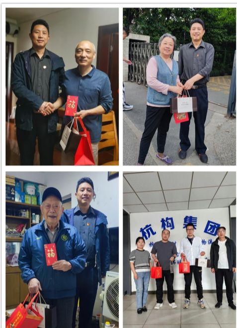
杭州亚运会蓄能发力。(杭构集团 朱哲韵)