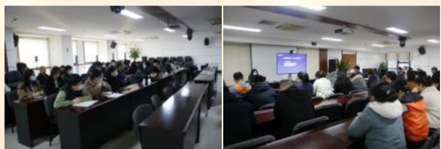
集团党委组织党员干部观看《从二十大报告看当前经济形势及未来发展改革重点》