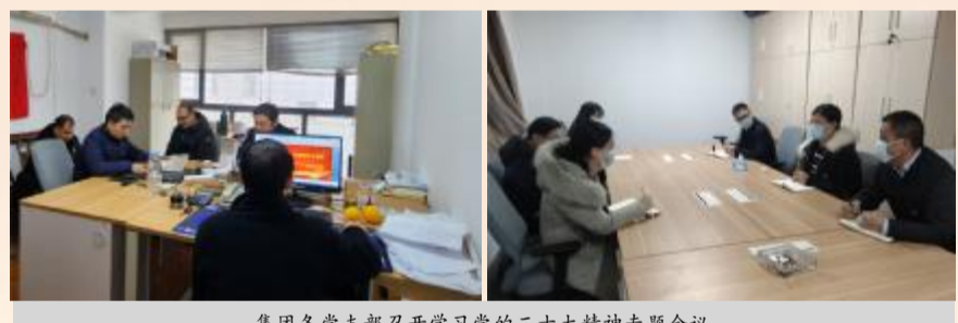
集团各党支部召开学习党的二十大精神专题会议