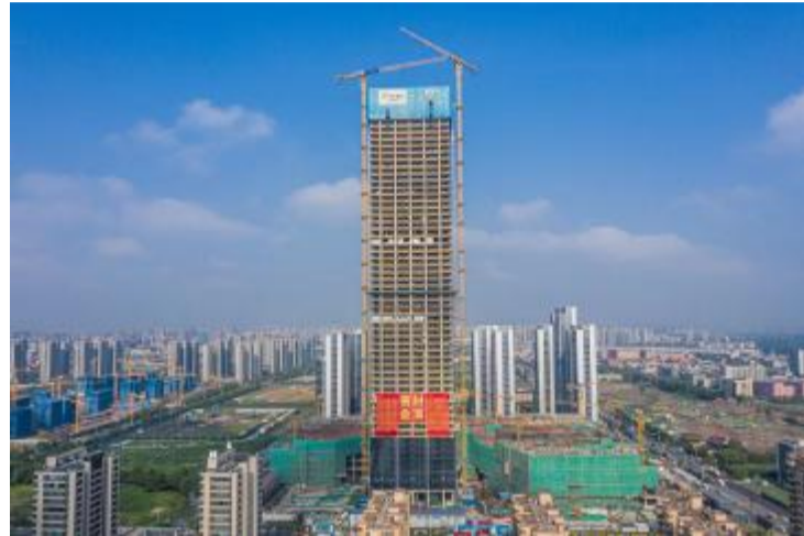
工人员交流混凝土施工实况。

在万象城喜结金顶的背后,是杭构集团仁和基地技术团队的倾力付出。杭州香积寺西延工程、地铁3号线同协站和笕丁站工地、商品住宅项目……施工现场时不时就会出现一个个忙碌的身影,他们一会在坍落度筒实测现场混凝土施工坍落度,一会在泵车出口查看混凝土泵送情况,一会在混凝土浇筑施工现场,和施