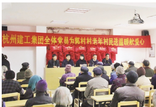
淳安县姜家镇郭村村与集团公司从帮扶到文明结对,已十余年,随着新农村建设,近年来,郭村村已发展扩大到由过去的庄口、上郭、下郭、东山下自然村四个村到现在组成一个村,现有村民2000多

作为践行“两学一做”学习教育重要内容之一,1月5日,集团新任“两委”书记及基层支部书记代表一行五人,带着集团全体党员浓浓的爱心,驱车三小时,前往与集团“文明结对”的郭村村开展为老年村民“送温暖、献爱心”活动。