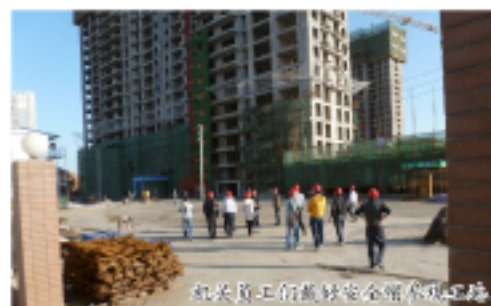
项目部的施工现场