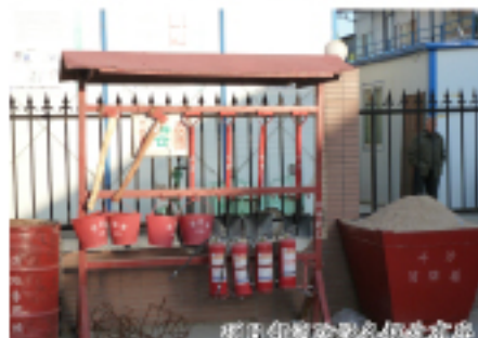
项目部的施工现场