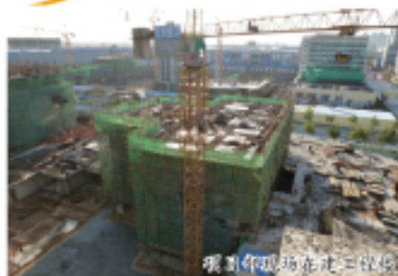
项目部的施工现场