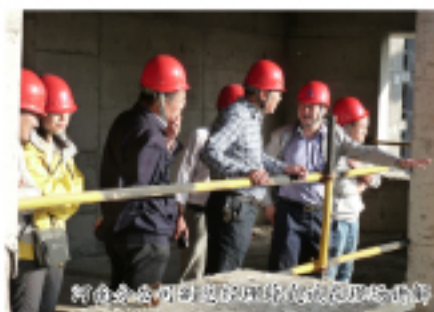
项目部的施工现场