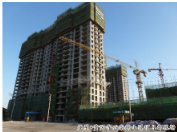
北京·尚兴华街小区 2010 年封顶