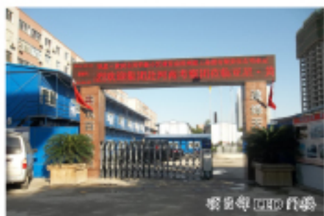
项目部的施工现场