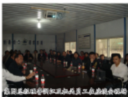
项目部的施工现场