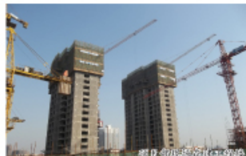
项目部的施工现场