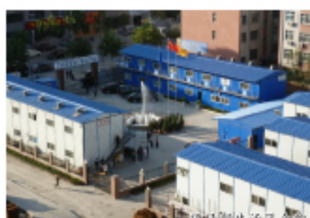
项目部的施工现场

时值深秋,2012年离我们越来越近,集团公司组织机关员工“下基层,看发展,谋新年规划”,一行40余人走进集团河南分公司及所属项目工地,看、听、问,着实让此行的机关员工感慨万千,萦绕在我们耳际的,便是该分公司负责人、项目经理们掷地有声的肺腑之言,“集团公司又好又快的发展了,河南分公司振兴中原的平台就稳固了,分公司员工就有使劲的岗位,更有家庭的温馨可言!”